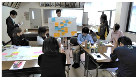
ワークショップ(イメージ)

また、安全管理の最初のステップとして、リスクの洗い出しからリスクへの対応について、ワークショップを通じて、これらの手法を習得します。