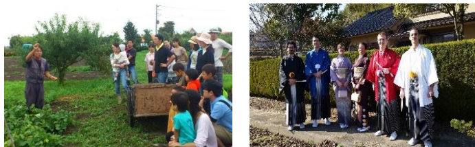
モニターツアー(イメージ)