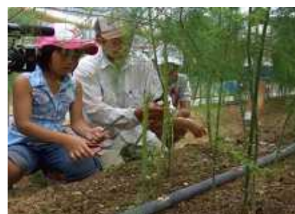
アスパラ収穫体験