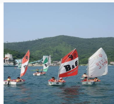
海洋性スポーツ体験