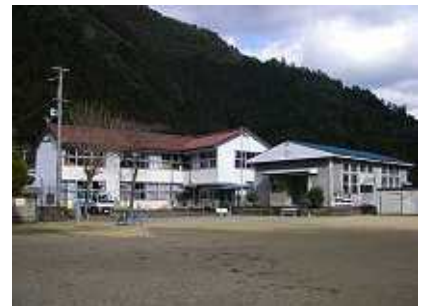
廃校となった地区の小学校