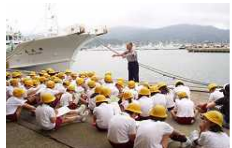
元漁師から漁業の説明を受ける子どもたち