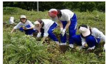
ホームステイ先での農業体験