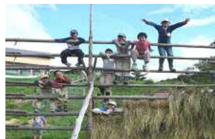
子どもたちによる稲のはさがけ体験