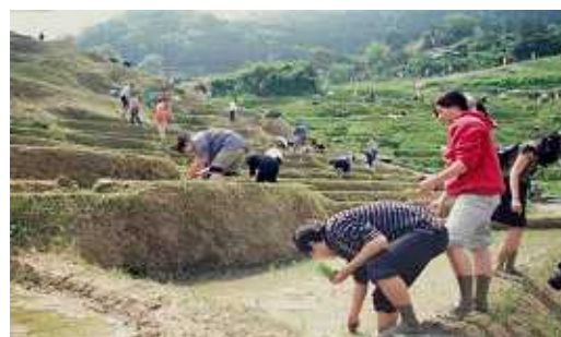
千枚田（輪島：田植え）