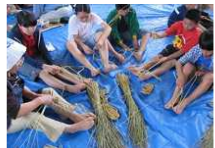
吉川わらざうり体験