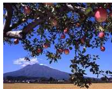
岩木山とりんごと稲