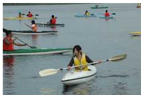
生花苗湖での1名のりカヌー体験活動