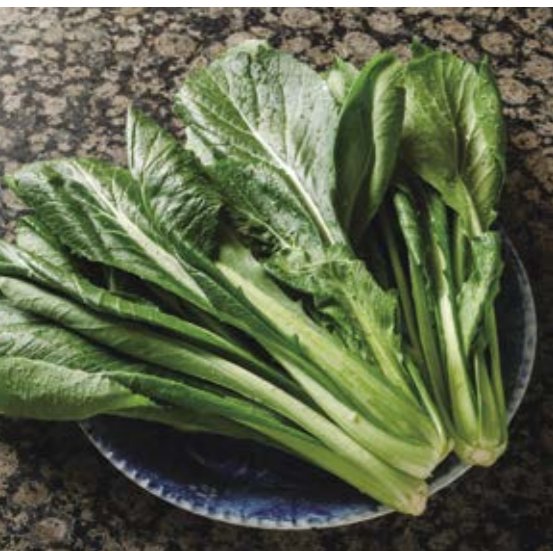
上…左から大阪黒菜・しろ菜・小松菜。比べてみると見た目の違いが分かる。下…みずみずしい大阪黒菜