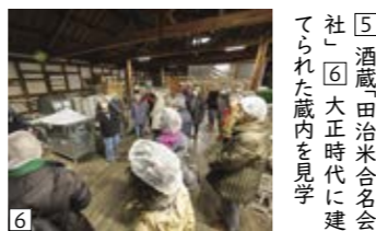
⑤ 酒蔵「田治米合名会社」 ⑥ 大正時代に建てられた蔵内を見学

重みがしっかりあるね」など話しながら、次々と収穫していました。畑では採れたてのねぎの炭火焼きも行われました。寒空で作業を終えた後、アツアツの甘いねぎの美味しさが染みわたります。「こんな贅沢な丸焼きは、普段なかなかできないから嬉しい」と、大好評でした。また、お茶も生産している池本さんに、自慢のほうじ茶の試飲もさせていただきました。