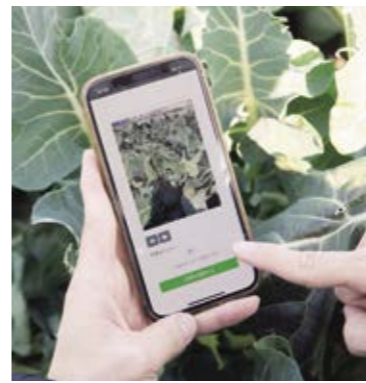
生育管理にカメラ機能も

とや販売先ごとの売上管理、肥料の管理、農薬使用量と使用回数自動計算するなど、業界初の便利な機能がたくさん詰まっています。ひとつの農園アカウントを複数名で同時利用することも可能なので、例えば、家族経営の農家がカレンダー機能をを使って、農作業の予定や年間の計画を共有したり、農園の売上状況をリアルタイムで共有することもでき、ユーザーのスタイルに合う使い込み方ができるのも魅力です。