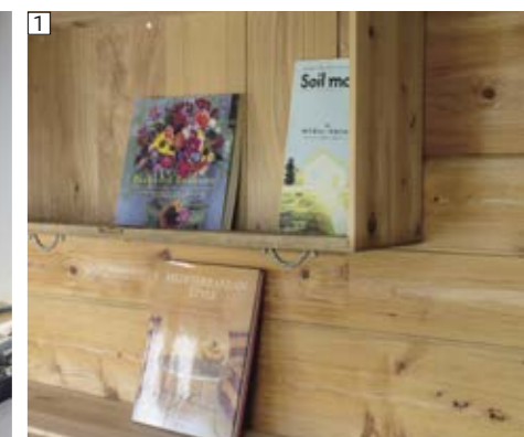
① 蔵から出てきた箆を使った本棚 ② 大正時代の蔵を改装した宿泊施設 ③ 囲炉裏を囲んで食事なども楽しめる