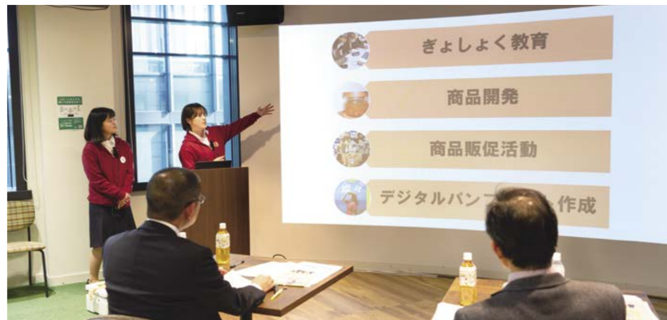
大賞に輝いた「愛南マダイ応援隊」のプレゼンテーション

本会は、全国各地の農山漁村地域において、地域を元気にする様々な活動に取り組む大学生・専門学生の活動を表彰する「学生地域づくり・交流大賞」を主催しています。第4回目となる今回は、2024年2月にAgVenture Lab(東京・大手町)で最終審査・表彰が行われました。