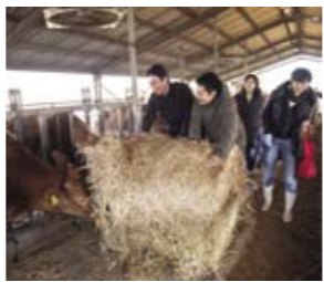
上：「リジエネラティブツーリズム in 阿蘇」ではあか牛の餌やり体験も実施された 下：なかむら牧場自家製のイタリアンライグラスを牛に配る参加者たち

りました。人の手で阿蘇の草原が守られているということを知り、自分も参加してみたいと思います。実際にやってみると想像以上に危険なことがあります、やけどなどの事故が起こらないように細心の注意を払いながら活動をしています」と、ボランティアとして参加する際の心持を話してくれました