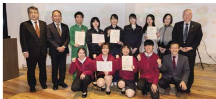
受賞者のみなさんと審査員の先生方