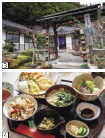
① 傷つけないように掘って収穫 ② 採れたての岩津ねぎを炭火で焼いて試食 ③ 寺カフェ「一休」で昼食 ④ 岩津ねぎの天ぷらなど地元食材がたっぷり

昼食は市内の寺カフェ「一休」へ。無人のお寺を活用したこちらでは、地元の食材をふんだんに使った御膳を頂きました。岩津ねぎの天ぷらやみそ和えなどに舌鼓を打ちます。お寺の敷地には可愛らしい花も咲いており、「この花は何？」など、地元の方々の交