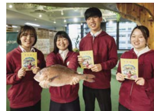
この日のために養殖マダイを持参し、気合たっぷり!

参加者はお互いの発表内容にも興味津々の様子でした。審査を待つ休憩時間には、自然と学生同士で交流が始まり、「どれくらい現地向いている?」「活動費は?」など具体的な運営方法や活動の悩み、素朴な疑問などを語り合