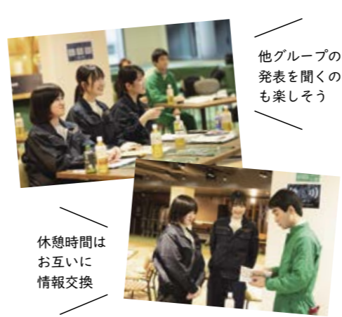
他グループの発表を聞くのも楽しそう

第4回目となる今回も、全国からたくさんの方の応募が寄せられ、2月9日に行われた最終審査(プレ