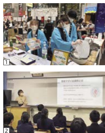
愛南マダイ応援隊の活動 ①松山市内のイベントに出店 ②高校生に向けた出張講義 ③地元ラジオ局でのPR